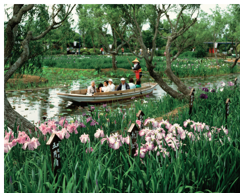
佐原水生植物園「あやめ祭り」6月29日まで