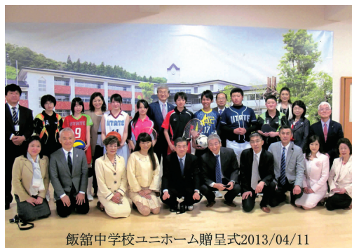
飯館中学校ユニホーム贈呈式2013/04/11