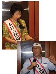
タスキでパワーアップ!!

ご参加頂きまして、大いに盛り上がりました事、親睦活動委員会を代表しまして、心より御礼申し上げます。