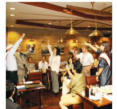
ジャンケンゲーム