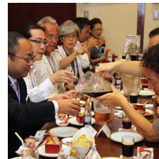
ビアホールならではの...