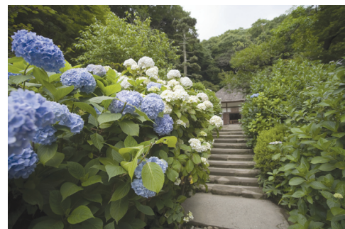
鎌倉明月院のあじさい