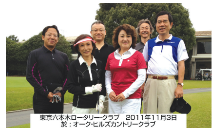
東京六本ロータリークラブ 2011年11月3日 於：オーク・ヒルズカントリークラブ