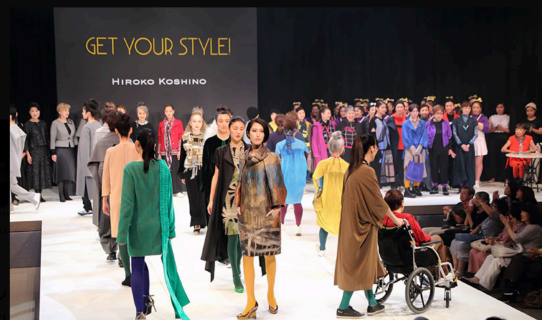
コシノヒロコファッションショー「GET YOUR STYLE!」

兵庫県立美術館内で、コシノヒロコファッションショー「GET YOUR STYLE!」を開催します。一流のヘアメイク、スタイリスト、フォトグラファー、演出家を起用し、コシノヒロコが完全監修する本格的なファッションショーです。ぜひ、ご覧ください。